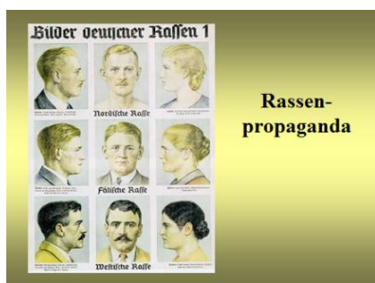
Mendels arvelove i Hitlertyskland