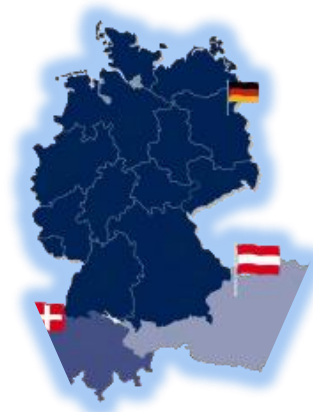
Tyskland, Østrig og Schweiz

Ungdomskultur Hitlertiden Eventyr Berlin og subkulturerne Kærlighed Øst- og Vesttyskland Krimier Tyskland i dag Sport