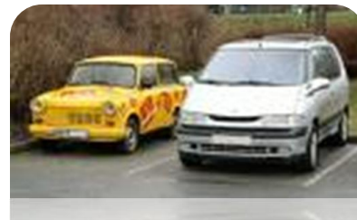
Øst- Vest og Tyskland i dag

Ungdomskultur Hitlertiden Eventyr Berlin og subkulturerne Kærlighed Øst- og Vesttyskland Krimier Tyskland i dag Sport