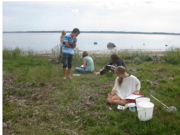
Her undersøger elever fra Frederiksværk Gymnasium plante- og dyreliv på strandengen ved Roskilde Fjord lidt øst for Sølager.

Gennem observationer i naturen og eksperimentelt arbejde i laboratoriet får du indsigt i samspillet i naturen og det bidrager til forståelse af betydningen af menneskets aktivitet - herunder principperne for bæredygtig udvikling.