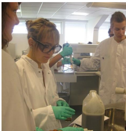
Her arbejder elever fra 1.y med spildevandsundersøgelser på Laborantskolen i Hillerød.

Biologi bidrager til menneskets forståelse af sig selv som biologisk organisme og samfundsborger – og giver faglig baggrund for udvikling af ansvarlighed, stillingtagen og handling i forbindelse med aktuelle samfundsforhold med biologisk indhold.