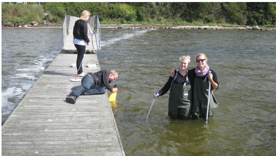
Feltundersøgelse i Roskilde Fjord, Hvide klint.