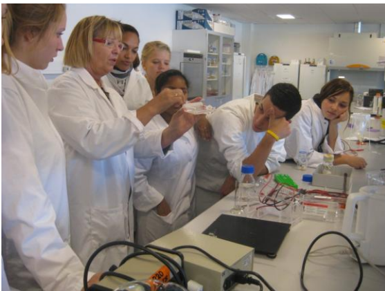
Her er en klasse på besøg på Laborantskolen i Hillerød, hvor de arbejder med bioteknologi

Billederne giver et lille indblik i hvordan vi arbejder i biologiundervisningen: